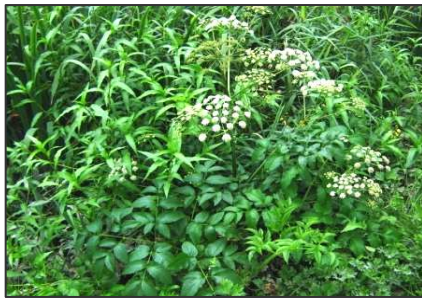
Angélique des estuaires

Le Château de Vayres et son parc ont été bâtis dans ce contexte.